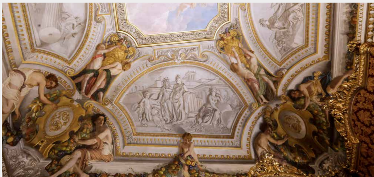
Particolare delle decorazioni della volta del Salotto rosso