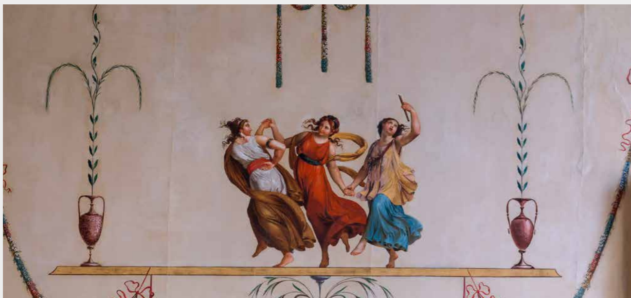
Particolare delle decorazioni della Sala pompeiana

Salendo lo scalone monumentale, voluto dal Fuga per sottolineare la maestosità del palazzo, si raggiunge il piano nobile, il secondo, con le sue sontuose stanze che hanno conservato in gran parte le decorazioni pittoriche originarie: