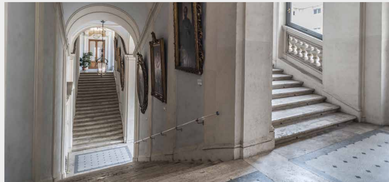
Lo scalone monumentale