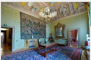
Il Salotto verde