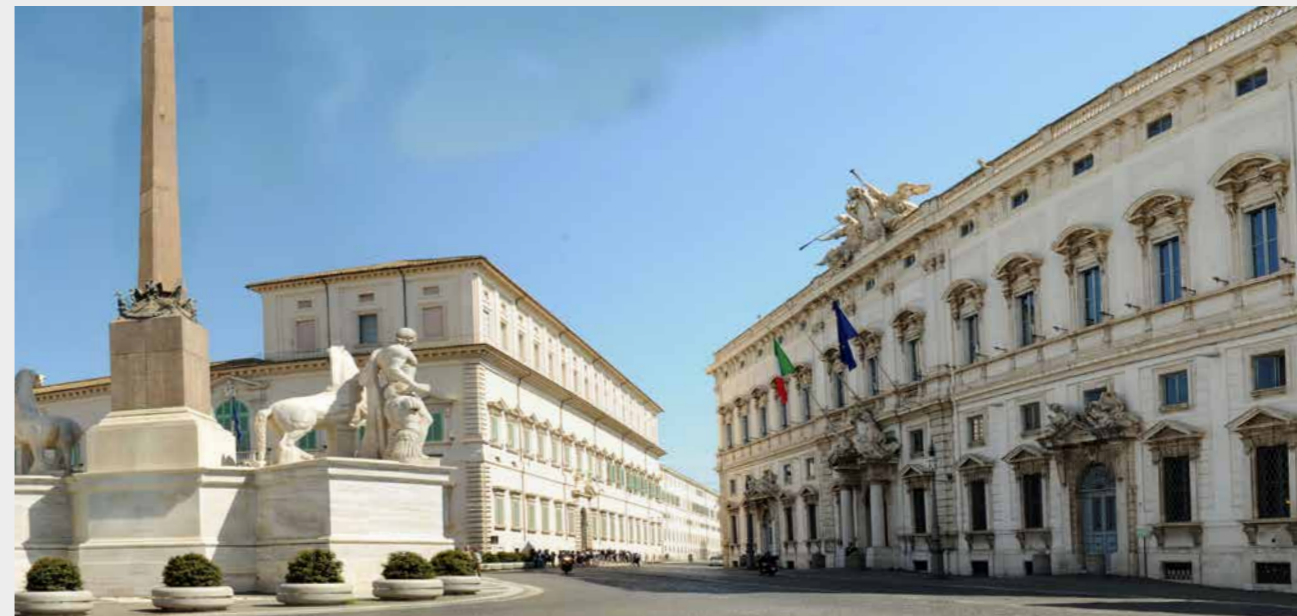
Il Palazzo della Consulta

Alla fine della Seconda guerra mondiale, il Ministero dell'Africa italiana venne soppresso, ma le sue strutture continuarono ad occupare per alcuni anni il palazzo, finché, nel 1955, l'edificio divenne la sede della Corte costituzionale: l'articolo 1 della legge numero 265 del 1958 stabilisce, infatti, che il Palazzo della Consulta "è destinato a sede permanente della Corte costituzionale".