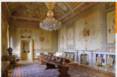
La Sala pompeiana