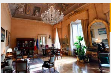
Lo Studio del Presidente