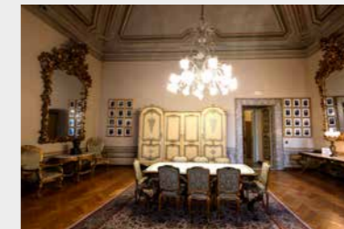
La Sala avvocati