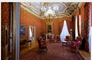
Il Salotto rosso