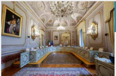
La Sala delle Udienze